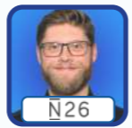
N26 Max Imbiel Co CISO