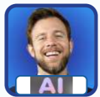
AI Florian Hübner Europas grösster KI Influencer